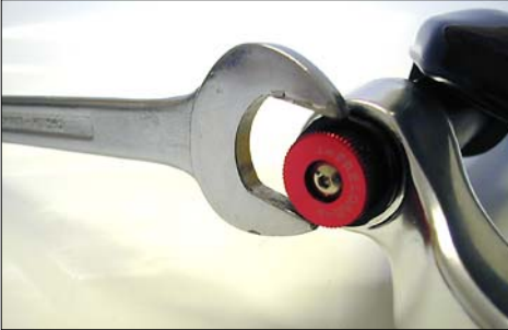
Nach dem Entspannen der Feder-Vorspannungseinheit kann die ganze Einheit herausgedreht werden.

Drehen Sie den Drehknopf für die Federgabel-Vorspannung auf der Vorspannungseinstelleinheit (9) gegen den Uhrzeigersinn locker bis zum Anschlag. So wird die Feder möglichst entspannt.