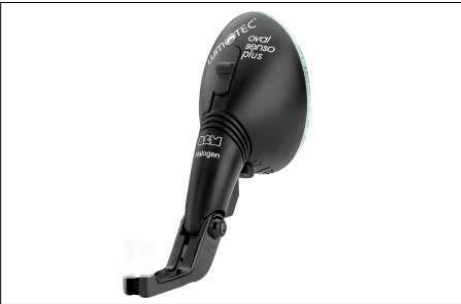
Die Beleuchtung mit Nabendynamo wird mit dem Schalter am Scheinwerfer eingeschaltet.

Die Lichtanlage mit Nabendynamo wird elektrisch eingeschaltet. Dazu befindet sich auf der Rückseite des Scheinwerfers ein Schalter mit drei beschrifteten Rastpositionen. Mit dem Schalter lässt sich die Beleuchtung AUS, EIN oder auf SENSOR schalten. Bei der Schaltposition SENSOR schaltet ein Dämmerungssensor im Scheinwerfer die Lichtanlage in Abhängigkeit von der Umgebungshelligkeit selbsttätig ein und aus.