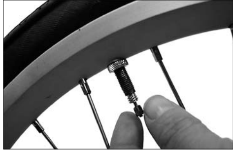
Zum Aufpumpen muss die Sicherungsmutter des Ventils nach oben geschraubt werden.

Die Schläuche sind mit Sklaverand-Ventilen (auch französische Ventile genannt) ausgestattet. Diese Ventile sind besonders luftdicht und lassen sich leicht aufpumpen. Schrauben Sie zunächst die Ventilschutzkappe ab.