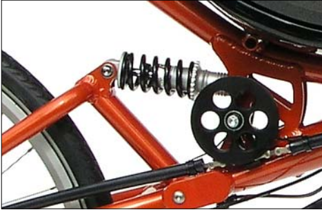
Federelement mit Stahlfeder. Durch das Drehen des Einstellringes am vorderen Ende der Feder stellen Sie die Federvorspannung ein.

Der Einstellring sollte nicht mehr als fünf Umdrehungen (von der entspannten Null-Lage aus gerechnet) gegen die Feder gedreht werden. Taucht die Federung auch nach sechs Umdrehungen noch zu weit ein, ist die Feder zu weich und muss gegen eine härtere Feder ersetzt werden. Eine zu große Vorspannung einer zu weichen Feder nutzt das Komfortpotential des Federelementes nicht aus.