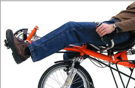
Der Tretlagerausleger wird so eingestellt, dass das Knie beim Fahren gerade nicht maximal durchgestreckt wird.

Stellen Sie den Tretlagerausleger so ein, dass Ihr Bein durchgestreckt ist, wenn sich die Ferse (mit flachem Absatz) auf dem Pedal in vorderster Position befindet. Erfahrungsgemäß wird beim Liegerad die Beinlänge etwas größer eingestellt als beim aufrechten Fahrrad. Beim Treten sollen sich die Ballen der Zehen über der Pedalachse befinden. Das Bein darf dann in der vordersten Position der Tretkurbel nicht maximal durchgestreckt sein. Ist der Abstand zu groß eingestellt, überwindet man diesen Totpunkt nur schwer, das Treten wird unrund, und die Sehnen des Fußes werden übermäßig belastet. Ist der Abstand zu klein, können sich schnell Knieschmerzen einstellen oder Ihre Beine gegen den (Oben-)Lenker stoßen.