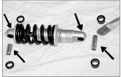
Die Lagerbuchsen des Feder-elementes müssen mit Fett geschmiert werden.

Schmieren Sie das Gewinde für die Federvorspannung gelegentlich mit einigen Tropfen säurefreiem, nicht harzenden Öl. Dadurch bleibt der Einstellring leichtgängig von Hand drehbar. Einmal jährlich müssen die Drehpunkte des Feder-elementes geschmiert