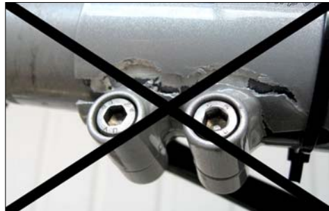
Wenn die Distanzbuchse fehlt, verdreht ist oder verschoben ist oder die Schrauben zu fest angezogen werden, kann der Rahmen beschädigt werden!

Achtung! Der Tretlagerausleger darf nur soweit aus dem Hauptrahmen herausgezogen gefahren werden, dass die Mindesteinschubtiefe von 8 cm nicht unterschritten wird. Keinesfalls darf das Ende des Tretlagerauslegers im Klemmschlitz beim Blick von unten auf den Hauptrahmen sichtbar sein, sonst könnte der Rahmen Schaden nehmen.