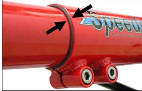
Zwischen Hauptrahmen und Tretlagerausleger muss die Distanzbuchse von vorne sichtbar sein.

Achtung! Der Tretlagerausleger darf nur soweit aus dem Hauptrahmen herausgezogen gefahren werden, dass die Mindesteinschubtiefe von 8 cm nicht unterschritten wird. Keinesfalls darf das Ende des Tretlagerauslegers im Klemmschlitz beim Blick von unten auf den Hauptrahmen sichtbar sein, sonst könnte der Rahmen Schaden nehmen.