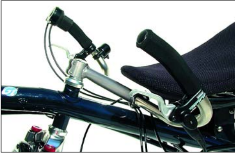
Der Lenker wird über den Vorbau mit der Gabel verbunden. Die Klemmverbindung zur Gabel erfolgt über die beiden seitlichen Schrauben.

Die Street Machine Gte wird entweder mit einem Untenlenker oder einem Obenlenker ausgeliefert. Bei beiden Lenkern erfolgt die Verbindung zur Gabel mit Vorbauten, die außen auf das Gabelschaftrohr geklemmt werden und gleichzeitig das Steuerkopflager fixieren. (sog. „A-Head-Vorbau“)