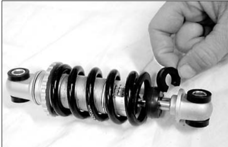
Durch das Aufstecken von Distanzclips auf die Kolbenstange des Federelementes wird der Federweg eingestellt.

Gefahr! Stellen Sie sicher, dass das Hinterrad, Schutzblech oder Federelement beim maximalen Einfedern nicht gegen Rahmen, Sitz, Gepäckträger oder Gepäckbox schlagen kann. Entspannen Sie dazu die Feder völlig, indem Sie den Federteller auf dem Gewinde des Federelementes bis zum Anschlag drehen (vorher den Sicherungsfederring aus der Nut im Gewinde zum Anschlag schieben). Setzen Sie einen Helfer auf das Rad, und bringen Sie durch Drücken auf den Sitz oder Gepäckträger das Rad zum Einfedern bis zum Endanschlag. Wird der Abstand zwischen Rad oder Schutzblech und Rahmen, Sitz oder Gepäckträger bzw. Speedbag kleiner als 1 cm, muss ein zusätzlicher Distanzclip montiert werden! Bei Nichtbeachtung kann das Schutzblech plötzlich brechen oder das Hinterrad blockieren, was zu Stürzen führen kann!