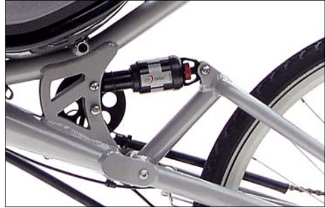
Federelement DT-Swiss XM180. Die Dämpfung wird durch verdrehen des roten Einstellrades am hinteren Ende verstellt.

Die Dämpfung beim Ausfedern sorgt dafür, dass das Hinterrad nicht „springt“, und ein möglichst guter Straßenkontakt erhalten bleibt. Durch die Verbesserung der Straßenlage schafft die Federung der Street Machine Gte somit ein echtes Sicherheitsplus.