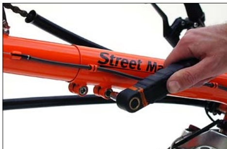
Lösen der Klemmschrauben zum Verstellen des Tretlagerauslegers.

Hilfreich beim Herausziehen: Damit die gespannte Kette das Herausziehen nicht behindert, schalten Sie auf das kleinste Kettenblatt und Ritzel und drehen Sie die Kurbeln beim Herausziehen etwas rückwärts.