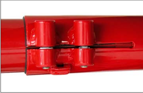
Beim Blick von unten in den Klemmschlitz darf das Ende des Tretlagerauslegers nicht sichtbar sein.